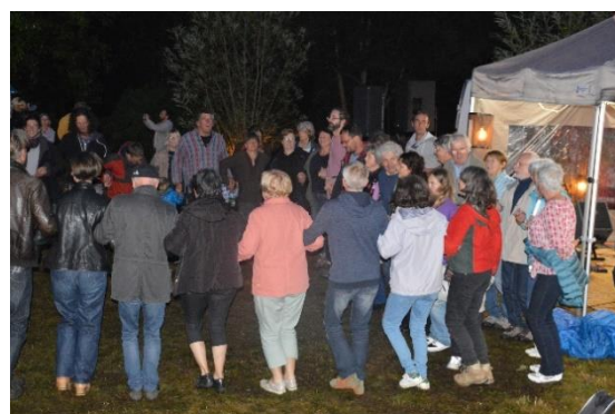
Le bureau de La Lescouëtaise

Tout cela a pu avoir lieu grâce aux bénévoles sans qui rien ne serait possible et qui méritent tous nos remerciements, remerciements que nous avons eu le loisir de leur transmettre de vive voix lors d'un apéro-casse-croûte